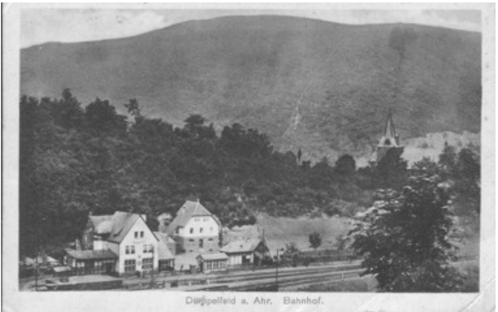
Dümpelfeld a. Ahr. Bahnhof.

Eigentlich beginnt die Geschichte des Buches über die Ahrstrecke bereits vor der offiziellen Museumseröffnung. 2007 reifte der Gedanke, eine Vortragsreihe ins Leben zu rufen. Gesagt, getan: 2008 wurde unter dem Motto „ Zeitreise Eisenbahn “ der erste Vortrag in den damaligen Vereinsräumlichkeiten, dem heutigen Eisenbahn-Museum, gehalten. Thema war die längst stillgelegte Strecke Ahrdorf – Blankenheim (Wald). Wir zählten etwas über 30 Besucher. 2009 war dann die Strecke Dümpelfeld – Lissendorf an der Reihe. Diesmal waren es schon über 60 Besucher. Die Strecke scheint eine magische Anziehungskraft zu besitzen. Zu Gast war auch der Bürgermeister von Dümpelfeld, der spontan fragte, ob man den Vortrag nicht in Dümpelfeld wiederholen könne. Das haben wir natürlich gerne gemacht und kamen so zu unserem ersten „Auswärtsspiel“. Auch in Dümpelfeld fand der Vortrag viel Anklang und die Vortragsreihe hat sich zwischenzeitlich durch gute Themen, gute Referenten und eine gute Aufbereitung zu einem Publikumsmagneten entwickelt. Als wir uns dann im Frühjahr 2010 im Vorstand der EFJ dazu entschlossen, die Aufarbeitung von Eisenbahngeschichte unter der Überschrift